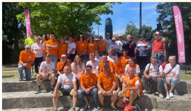
L'équipe des bénévoles de l'édition 2025