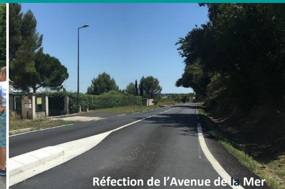
Réfection de l'Avenue de la Mer