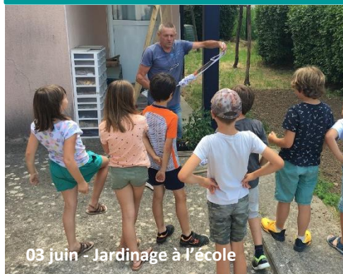
03 juin - Jardinage à l'école

LE MAGAZINE D'INFORMATION MUNICIPAL DU VILLAGE DE SAINT-SERIES - N° 06 – JUIN 2022