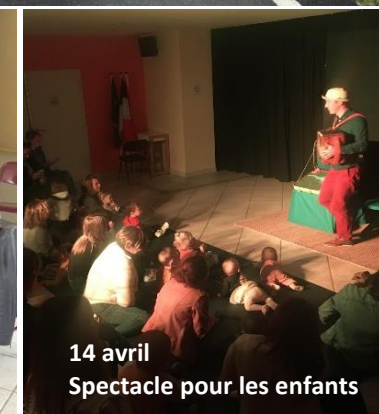
14 avril Spectacle pour les enfants