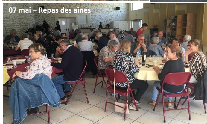
07 mai – Repas des aînés